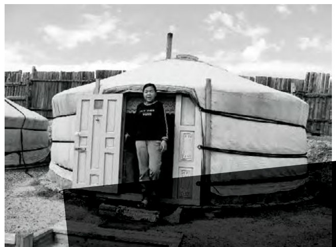
Dankbar Ger der Familie Bjanbanaran