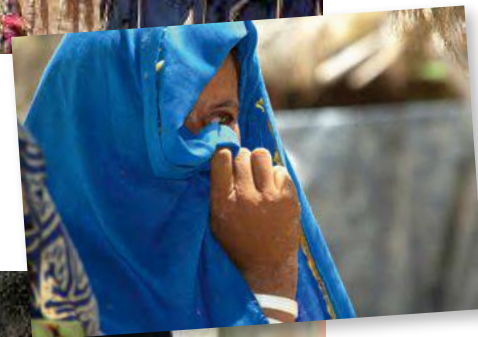
Pakistan Verzweiflung hinter dem Schleier verborgen