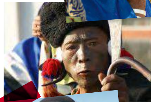
Nordostindien Grimmige Gestalten: ehemalige Kopffäger