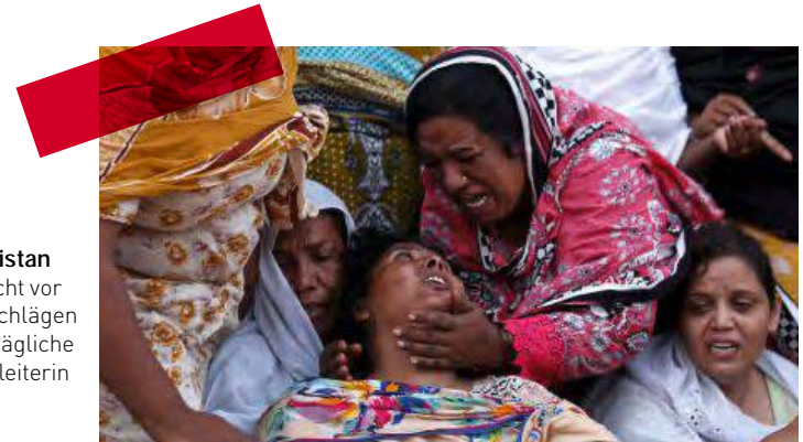
Pakistan Furcht vor Anschlägen als tägliche Begleiterin