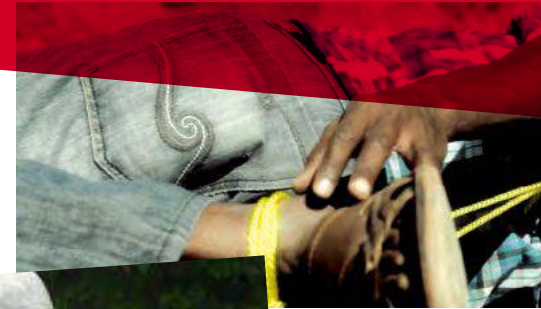
Eritrea Ausgeklügelte Foltertechniken