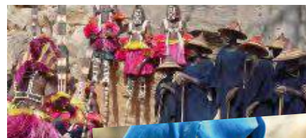
Mali Animistischer Kult