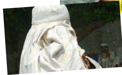
Afghanistan Religiöser Terror: Tod bei Abfall vom Islam