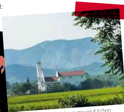
Vietnam Die Anerkennung von Kirchen untersteht der Willkür regionaler Behörden