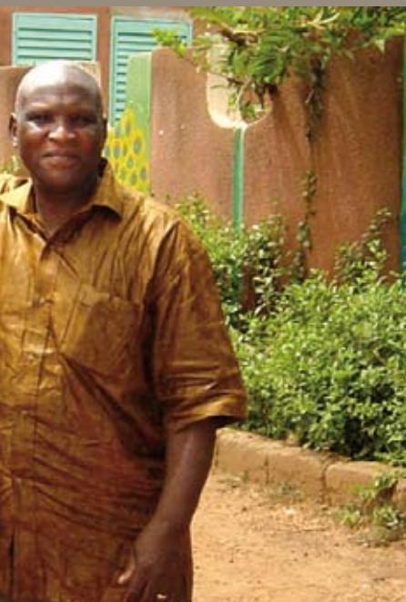
Jesus statt Mohammed