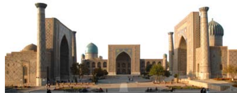
Usbekistan Keine Freiheit für Christen

Auch 2010 hat sich AVC wieder für verfolgte Christen und ihre Familien eingesetzt. Besuche und persönliche Begegnungen ermutigen sie sehr. Sie erfahren, dass sie nicht vergessen und allein gelassen sind. Finanzielle Unterstützung ermöglicht das Überleben, hilft Vertriebenen und den Familien von ermordeten Christen.