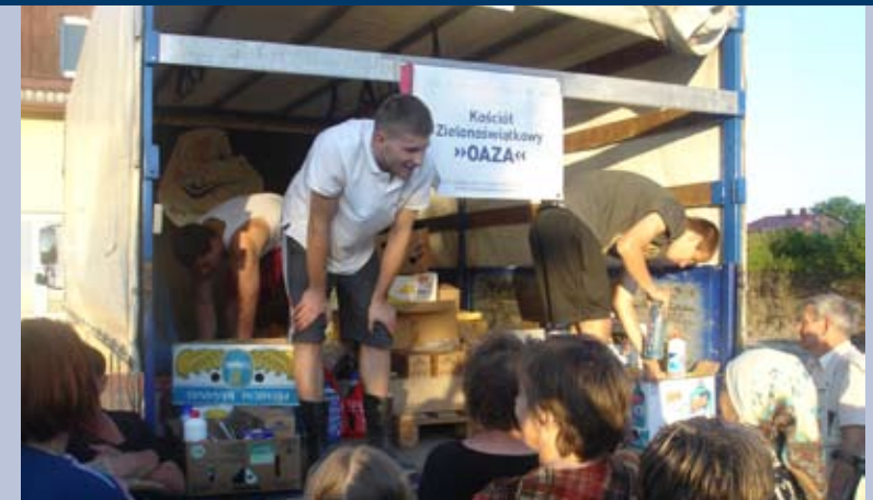
Polen Hilfsgütertransport nach der Überschwemmung