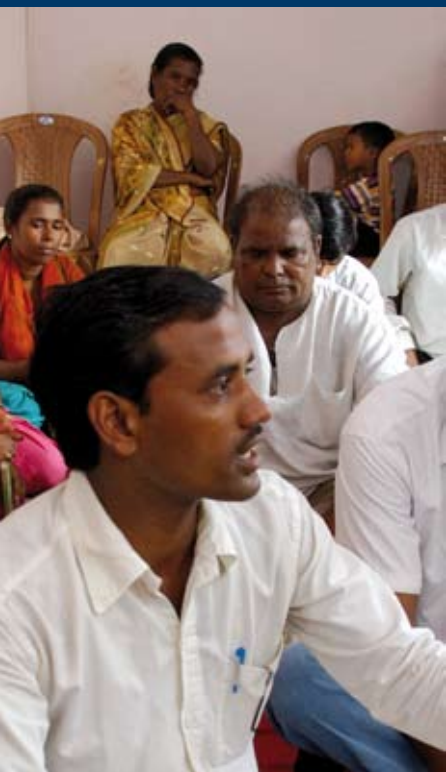
Malige Hindus und Muslime als Nachbarn Hauskirche in Delhi