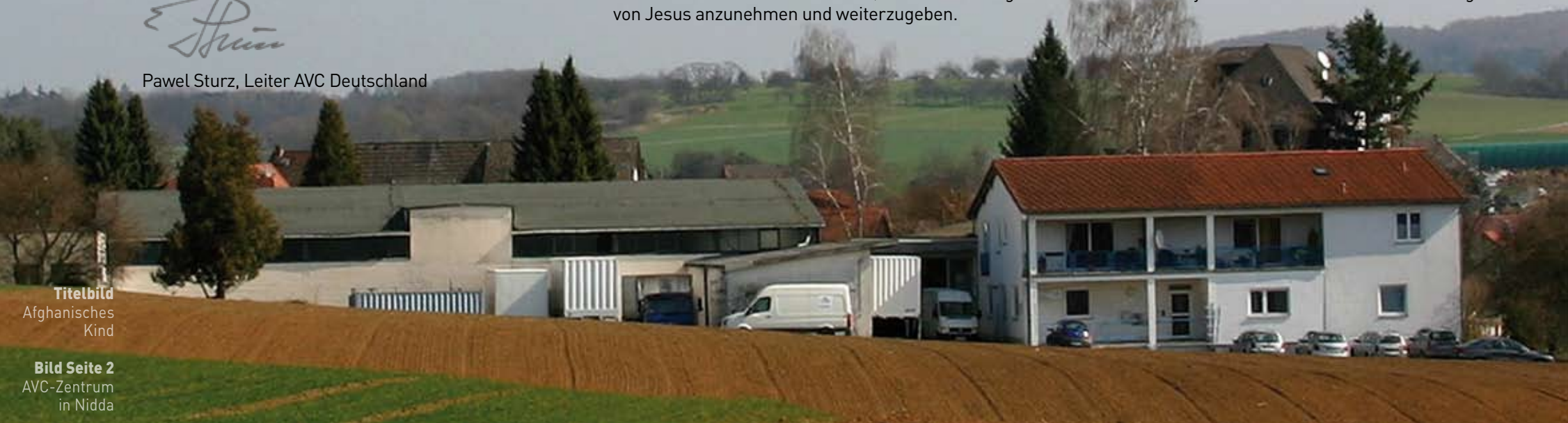
Bild Seite 2 AVC-Zentrum in Nidda