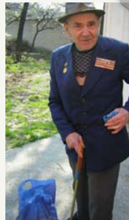
Ukraine Veteran erhält Hilfe