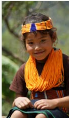
Indien Kindern am Ende der Welt helfen