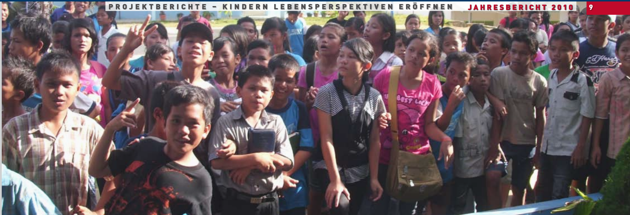
Schule im Sorkam, Indonesien