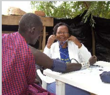
Tansania Schon ein Lächeln kann helfen