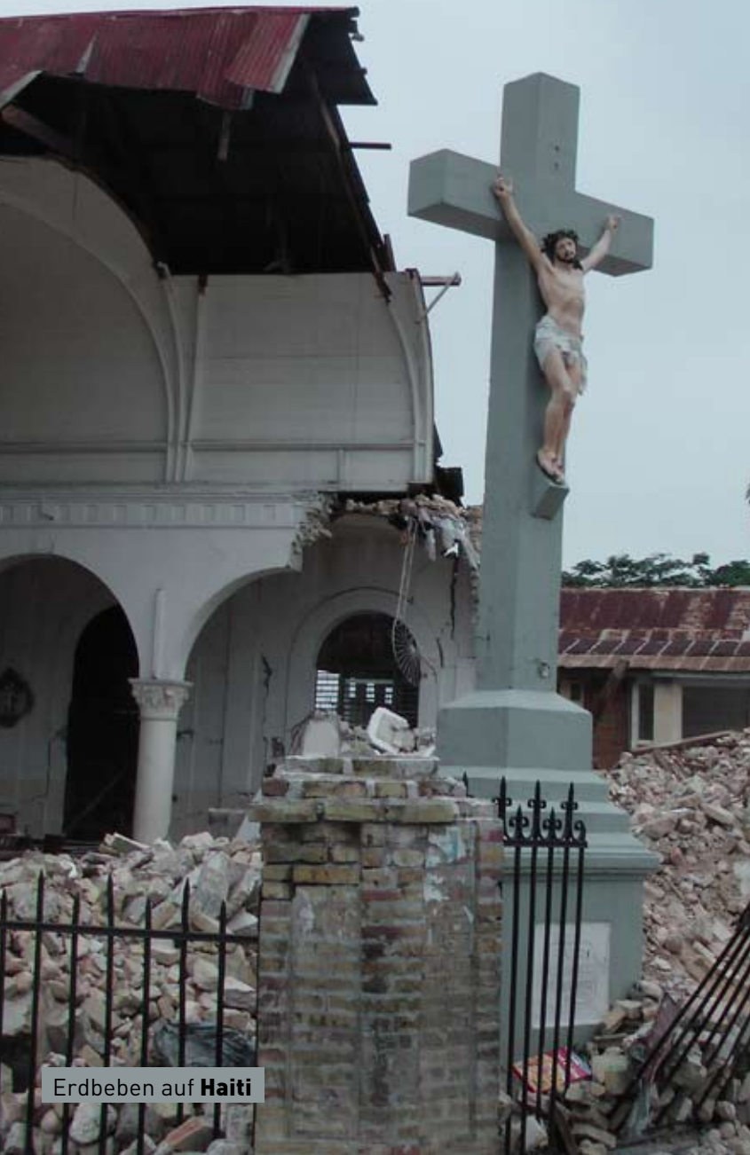
Erdbeben auf Haiti