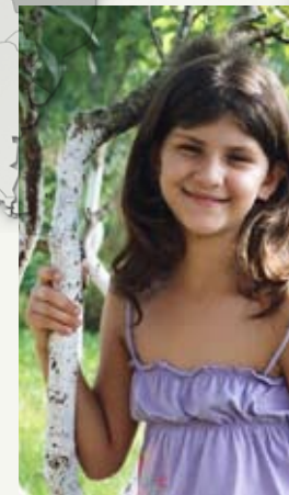
Brasilien Zuhause im Heim gefunden