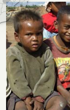
Madagaskar Leben auf der Abfallhalde