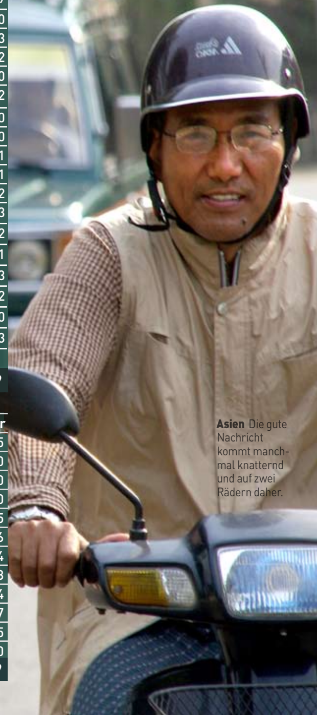
Asien Die gute Nachricht kommt manchmal knatternd und auf zwei Rädern daher.