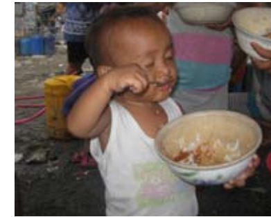
Philippinen Kinderspeisung in den Slums von Manila