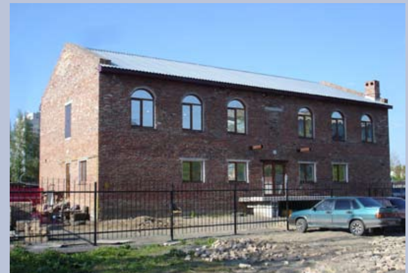
Sibirien / Omsk Gemeindehaus