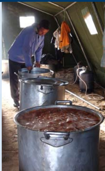
Engagiert Christen vor Ort

Der Funke in Tunesien setzt auch Ägypten und Libyen in Brand. Als Folge schlägt eine Flüchtlings- welle ins Ursprungsland zurück. Zwei Mitarbeiter von AVC haben Tunesien besucht.