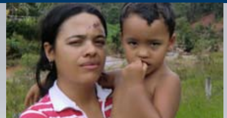
Josiele Ehemann und Tochter verloren