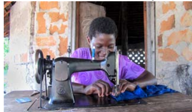
Azubi bringt die gute alte »Singer« zum Schnurren