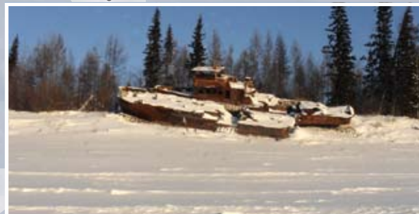
Schiffswracks Hinweis auf einen See unter der Eisdecke