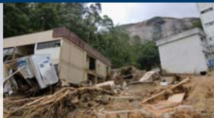
Kinderklinik Sämtliche Kinder tot