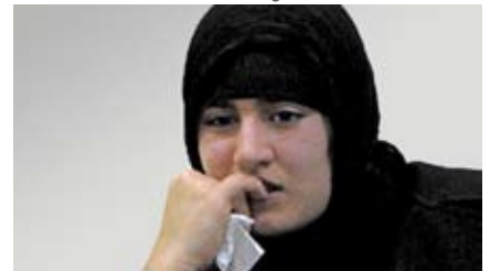
... und als 16-Jährige in Trauer um ihren Mann

sul zusammen mit seinem Bruder aus dem Auto gezerrt und ermordet. Die junge Frau wohnt jetzt bei ihren Schwiegereltern, um so die Liebe zu ihrem Mann wachzuhalten.