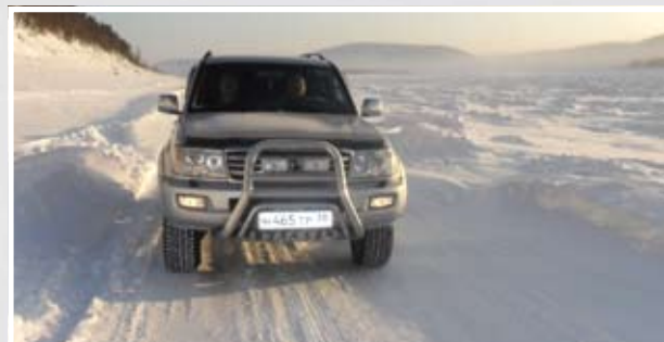
Frage des Überlebens Zwei Fahrzeuge mit Spezialausrüstung