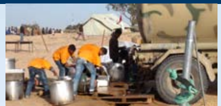
Mangelware Wasser per Tankwagen angekarrt

In der Nähe der Grenze zu Libyen leben mittlerweile 20 000 Flüchtlinge: 88% aus Bangladesh, 5% aus Somalia, 4% aus Mali. Der Zustrom hält an. 2000 sind allein am Tag unseres Besuches an der Grenze angekommen; nur 600 von ihnen konnten weiterreisen. Die tunesische Bevölkerung, Helfer und Soldaten geben ihr Bestes und beweisen eine beispielhafte Gastfreundschaft. Privatpersonen haben spontan ganze Lastwagenladungen mit Essen ins Lager gebracht. Doch der Ansturm der Flüchtlinge überfordert die Helfer total. Im Moment haben sie die Lage noch im Griff, sie kann aber jederzeit außer Kontrolle geraten.