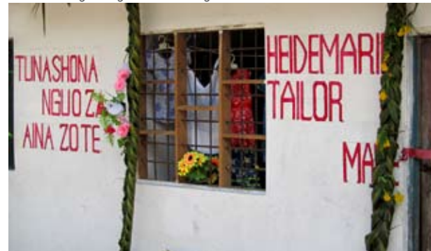
Klein-Business auf Mafia Vertrieb der Hand-Made-Produkte