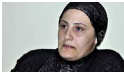
Trauer Christlicher Ehemann ermordet

Meist sind es Familienväter, die ermordet worden sind. Ohne ersichtlichen Grund oder einfach, weil sie Christen waren. Selbst in der als sicher geltenden Stadt Alqosh wurde vor fünf Monaten ein Mann erschossen. Er arbeitete als Nachtwächter in einer Fabrik. Seine Witwe – gerade 24 Jahre alt geworden – will nun für den Rest ihres Lebens Trauer tragen