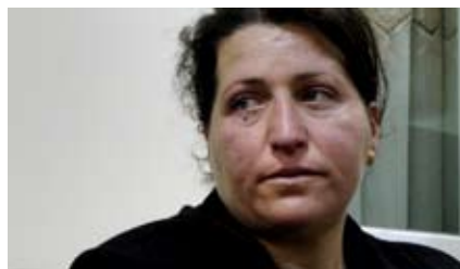
Mit Ungewissheit leben Mann verschollen

Eine weitere Irakerin, noch keine 40 Jahre alt, hat fünf Töchter. Fünf Jahre zuvor war ihr Mann gekidnappt worden und ist seither verschollen. Die Sorge um ihre Mädchen bringt sie um den Schlaf, denn es ist nicht ungewöhnlich, dass junge Frauen verschleppt werden und nie wieder auftauchen. Geld hat sie keines mehr. Ihre Ersparnisse hatte sie jemandem anvertraut, der dafür nach ihrem Mann suchen wollte. Von beiden hat sie nichts mehr gehört.