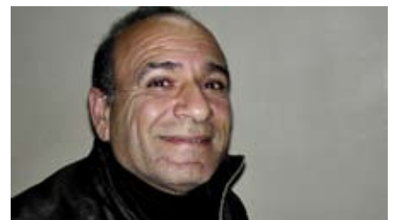
Chemiker Erinnerung ausgelöscht

Der Familienvater, den ich in Amman besucht habe, ist Goldschmied und Chemiker. Er arbeitete an der Entwicklung geheimer Waffen. Mittels Injektionen wurde sein Erinnerungsvermögen teilweise zerstört. Seine Hände sind aufgrund der inneren Spannung zu Fäusten verkrampft, seine Berichte von Angst durchdrungen. Die Töchter verbringen den größten Teil des Tages auf ihrer feucht-kalten Matratze. Den Kellerraum zu verlassen, trauen sie sich nicht. Sie gehören einer religiösen Minderheit an und fürchten, entführt zu werden.